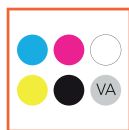
CMYK, Klar & Weiß