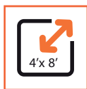
Druckformat 1250 mm x 2540 mm